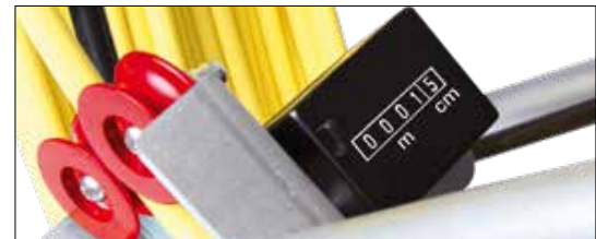
METERTELLER - Telt in meter en 10 centimeter. COMPTEUR - Compte en mètres et en décimètres.