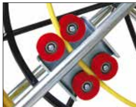
QUICK RUN met gemonteerde rollen. avec des rouleaux montés.