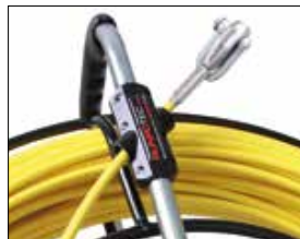
Automatische RUN-OUT rem. Frein de RUN-OUT automatique.