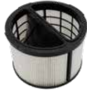
SU 118100 SU 118166