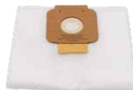
SU 106061 SU 106013