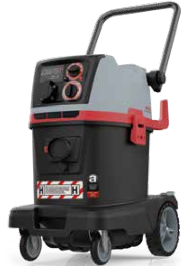
CRAFTIX 35 H SU 118060