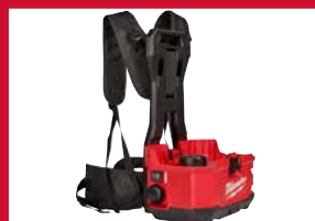
Larges sangles pour plus de confort pour l'utilisateur.