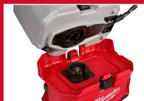
Ajoutez et remplacez les réservoirs pour éliminer la contamination croisée des produits chimiques.