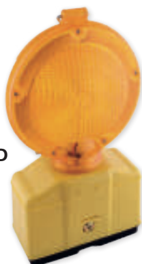
WA 1002 + beugel / attache

Knipperlicht met gele lens, automatische ontsteking en uitschakeling dmv. foto-elektrische cel, antidiefstal beugel (zonder sleutel) Lampe clignotante avec lentilles jaunes, interrupteur crépusculaire automatique par cellule photo-électrique, attache anti-voil (sans clé)