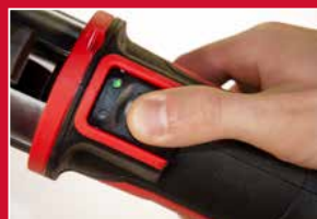
Indicateur de pression FORCE LOGIC™