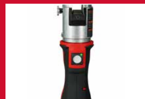
Une gamme élargie : jusqu'à 108mm sur du cuivre, de l'acier et de l'acier inoxydable, + 4" dans les tuyaux en acier