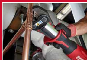
Sertissage avec une seule main