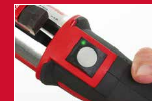
Indicateur de pression FORCE LOGIC™