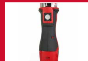
Plus compacte : design vertical