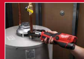
Utilisation à 1 main