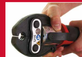
Tête rotative à 360°