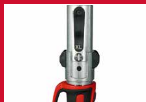
Indicateur de pression FORCE LOGIC™