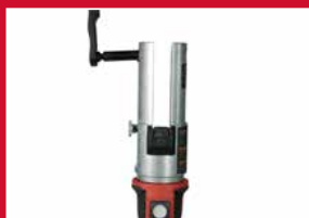
Auto-cycle : cycle de pression complet automatique