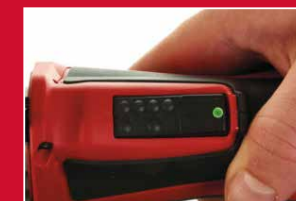
Indicateur de presse