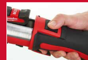
Sertissage avec une seule main